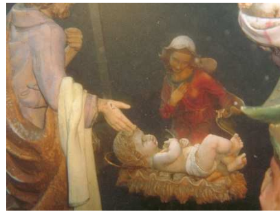
Natività nel Lago di Lugano