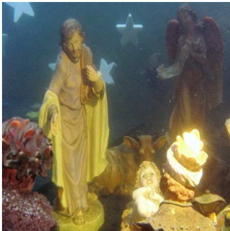
Particolare del Presepe Sommerso