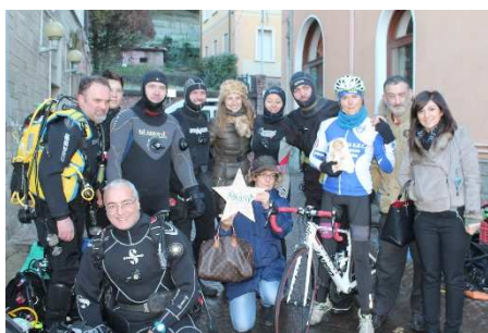
Dalla bicicletta al fondale