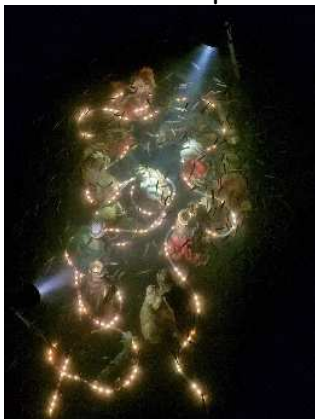
Alborelle sul Presepe Sommerso