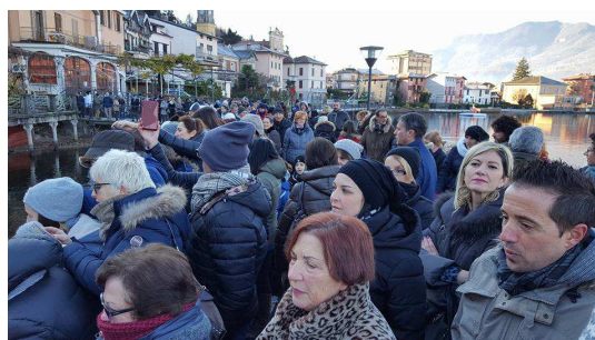
Folla sul lungolago alla posa del Presepe