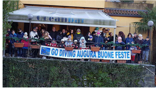
Auguri da GODiving