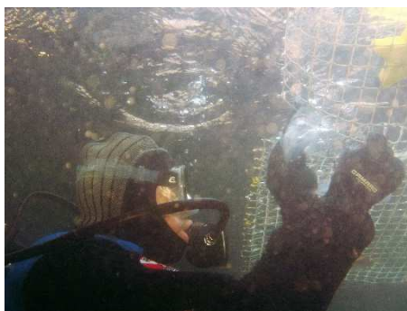
Al lavoro sul Presepe Sommerso