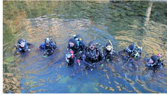
I sub dopo la posa del Presepe