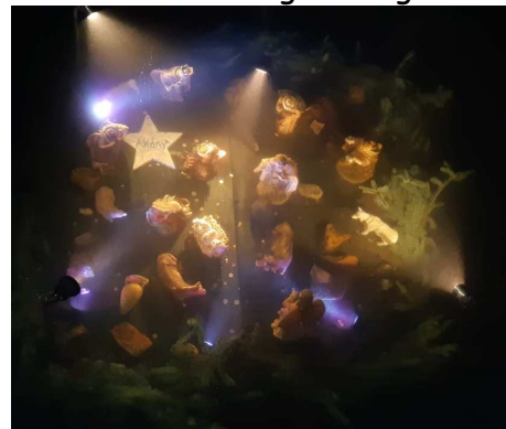
Il Presepe Sommerso di notte