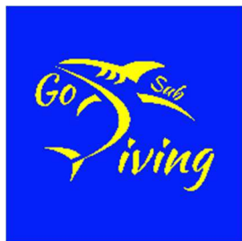
Logo gruppo sub GODiving

IMMAGINI A CORREDO (su richiesta saremo lieti di fornire altro materiale)