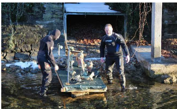
Il presepe scende in acqua