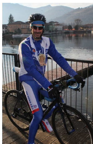
Gesù arriva in bici da Busto Arsizio