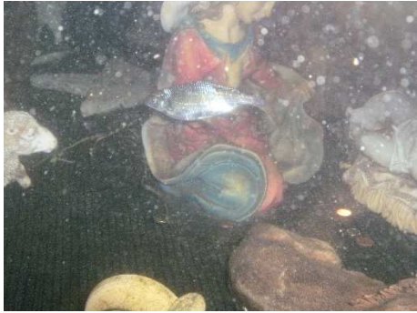
Un visitatore incuriosito